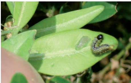
Jungraupe von Glyphodes perspectalis beim vorerst noch oberflächlichen Blattfrass. Jeune chenille de Glyphodes perspectalis en train de manger d'abord la surface supérieure d'une feuille.

ten Buxus sinica aus China. Laut Informationen an der letztjährigen Deutschen Pflanzenschutztagung in Kiel kann er zudem an Ilex purpurea , Euonymus japonicus und E. alatus auftreten.