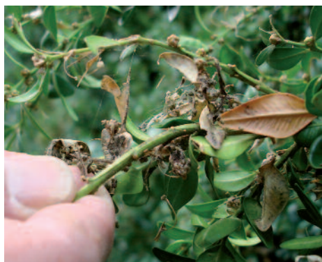
Mit Kot versetzte Gespinste sind typisch und deuten auf den Befall durch den Buchsbaumzünsler hin. Les excréments et les cocons sont typiques et indiquent clairement une attaque de pyrale du buis.