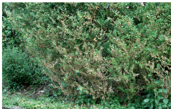
Wenn von unten her verbräunte Stellen sichtbar werden, sind die Büsche im Innern oft bereits kahlgefressen. Lorsque des places brunes sont visibles d'en haut, les buis sont souvent déjà dénudés à l'intérieur.