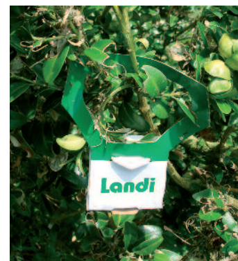
Versuchsweise Bekämpfung mit Trichogramma -Schlupfwespen. Essais de lutte avec des ichneumons (Trichogramma).