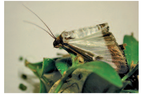
Tagsüber sitzen die Falter meist auf der Blattunterseite anderer Pflanzen. Durant la journée, le papillon de la pyrale du buis se fixe sous les feuilles d'autres plantes.

Der erwachsene Falter ist dann braungrau und nachtaktiv. Er hat eine Lebensdauer von etwa acht Tagen. In dieser Zeit sucht der schnelle und wendige Flieger, der jedoch keine weiten Strecken zurücklegen kann, die Buchsbäume der Umgebung auf. Dort legt das Weibchen seine Eier ab. Im Umfeld von befallenen Pflanzen lassen sich die Falter übrigens oft auch im Licht der Strassenlampen beobachten.