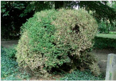
Frassbild an Buxus bei starkem Befall. Ungeschnittene Exemplare werden gleichermassen befallen. Mangeurs sur buis dans le cas d'une forte attaque. Les exemplaires non taillés sont pareillement atteints.