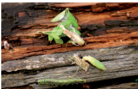
Puppen und Jungraupe des Buchsbaumzünslers. Die Tiere überwintern in zusammengesponnenen Blättern. Les puppes et jeune chenille de la pyrale passent l'hiver dans des logettes tissées entre deux feuilles.

und weisse Streifen, schwarze Punkte, weisse Borsten und eine schwarze Kopfkapsel. Ein einzelnes Exemplar verzehrt bis zu 40 Blätter täglich!