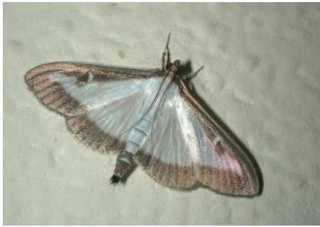
Der Falter des Buchsbaumzünslers ist ein schneller Flieger und nachtaktiv. Le papillon de la pyrale du buis vole rapidement et s'active la nuit.

Problematisch an diesem Schädling sind die äussert gefräßigen, bis fünf Zentimeter langen Raupen des Falters. Sie sind gelbgrün bis dunkelgrün gefärbt und haben schwarze